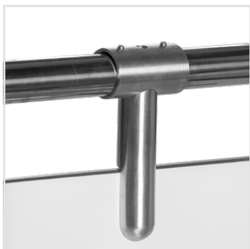
horní trubkový profil pr.30mm (nerez) do šířky desky 60cm nemusí být horní profil použit