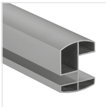
horní profil (Al elox)