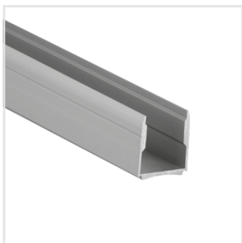
U profil k uchycení desek na stěnu (Al elox)