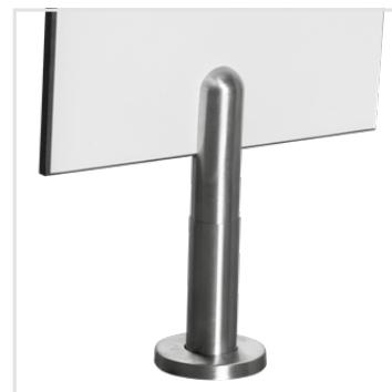
rektifikační noha (nerez)