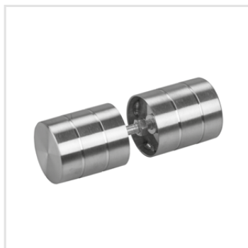
dveřní úchytka do kabinky (nerez)