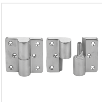
samodovírací panty (nerez)