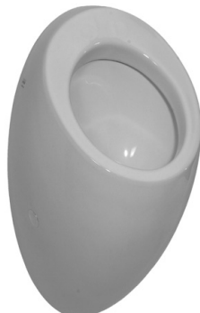
SLP 25 - ALESSI BEZ POKLOPU