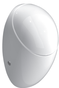
SLP 24 - ALESSI S POKLOPEM