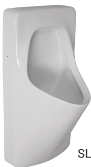
SLP 20 - ANTERO