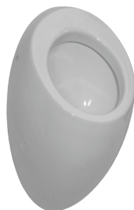
SLP 25 - ALESSI