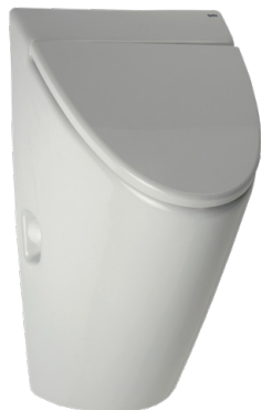
SLP 32 - ARQ S POKLOPEM