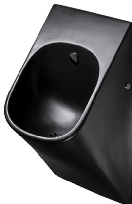
SLP 89S - LA FONTANA