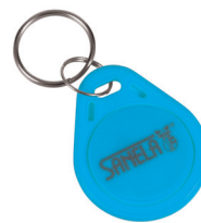
1 ks ze sady 50 ks žetonů SLZA 51B