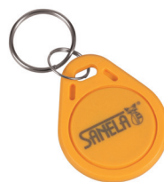
1 ks ze sady 50 ks žetonů SLZA 51