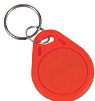
1 ks ze sady 50 ks žetonů SLZA 51R