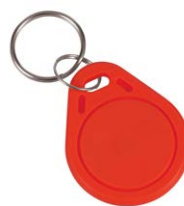
1 ks ze sady 50 ks žetonů SLZA 51R