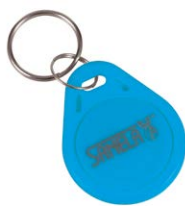
1 ks ze sady 50 ks žetonů SLZA 51B