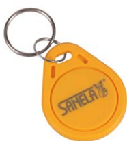
1 ks ze sady 50 ks žetonů SLZA 51