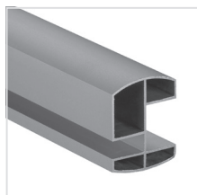
horní profil (Al elox)