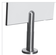
rektifikační noha (nerez)