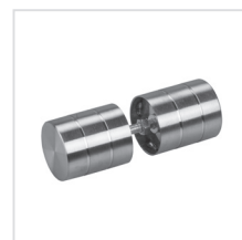
dveřní úchytka do kabinky (nerez)