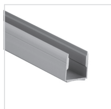
U profil k uchycení desek na stěnu (Al elox)