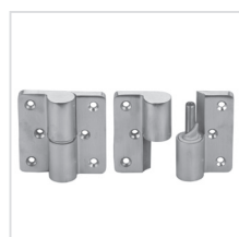
samodovírací panty (nerez)