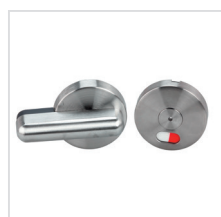
zavírač se signalizací volno/obsazeno (nerez)