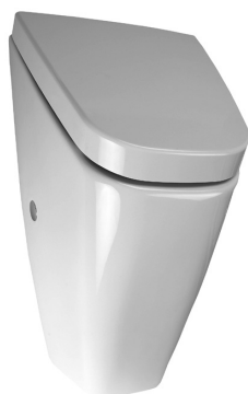
SLP 37 - VILA S POKLOPEM