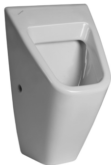
SLP 12 - VILA BEZ POKLOPU