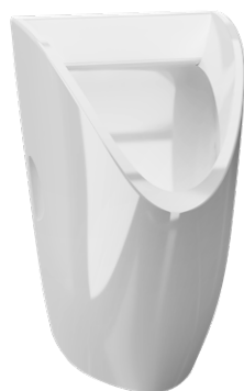
SLP 27 - Šik